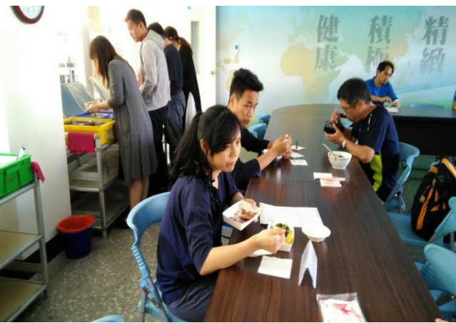
家長代表到校關心午餐供餐、用餐情形