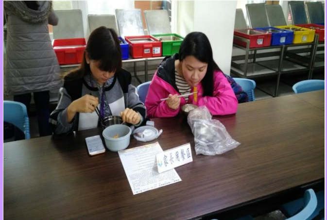
每期配合午餐滿意度調查邀請家長到校