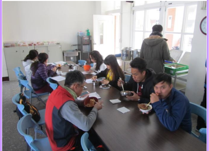
家長入校實地了解午餐運作情形及菜色