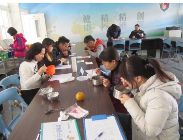
各學年推薦 2-3 位家長代表到校