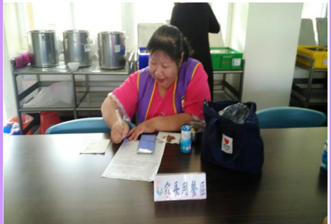
吃完午餐填寫滿意度問卷提供意見