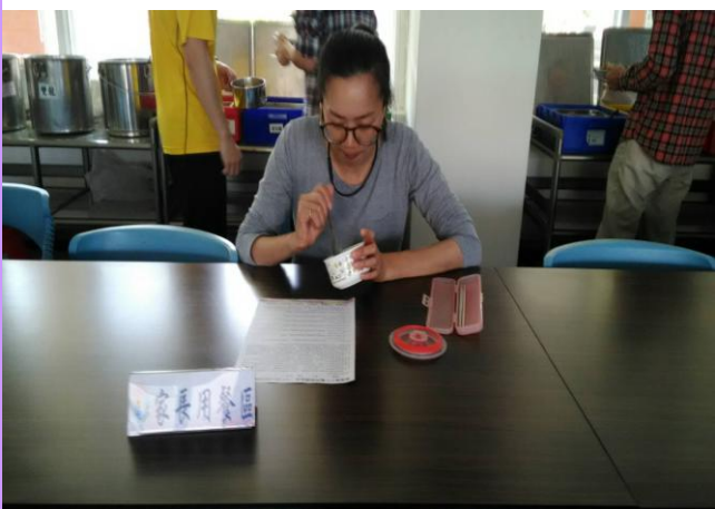
學年老師推薦 2-3 位家長代表到校