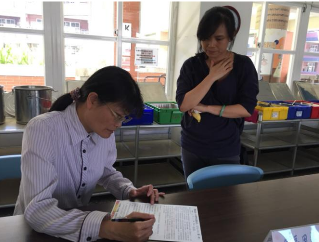
午餐秘書等行政同仁與家長多向溝通