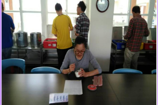
實地了解學校午餐運作情形及菜色