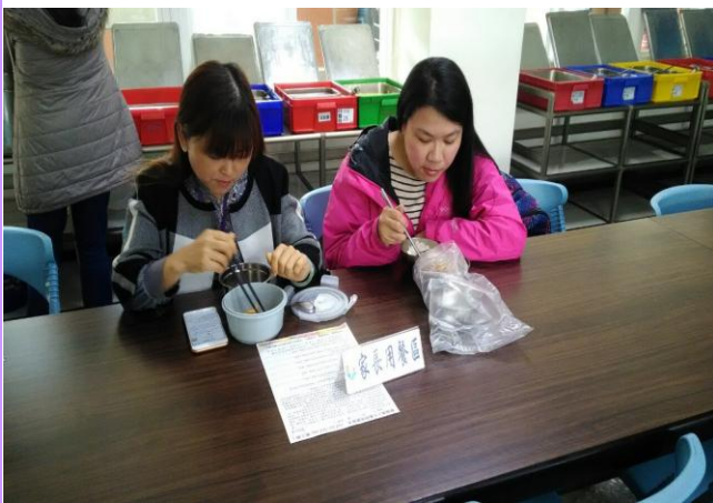
邀請家長代表入校關心午餐供餐情形