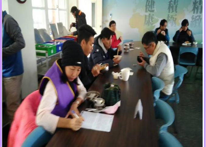
吃完午餐填寫滿意度問卷提供意見